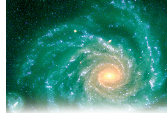
DAGMAR EHRLINSPIEL ÄRZTIN FÜR ALLGEMEINMEDIZIN-HOMÖOPATHIE

HEILFASTEN AN DER OSTSEE UNTER ÄRZTLICHER LEITUNG